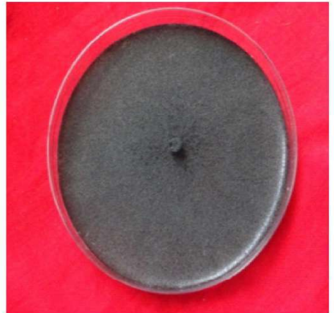
चित्र: पेट्री प्लेट की मैक्रोफोमिना फेजोलिना

यह रोग प्रायः शुष्क क्षेत्रों में प्रचलित है। इस रोग में भी पौध की परिपक्वता दिखाई देती हैं। प्रभावित पौधा आमतौर पर सूख जाता है। तने की सतह पर छोटे, गोल, काले, पिनहेड जैसे स्क्लेरोटिया दिखाई देते हैं। जब तने को काटकर देखा जाता है, तो काला पाउडर सवहनी बंडलो और तनो पर दिखाई देता है। पुष्पण के बाद शुष्कवस्था (जलकमी) उत्पन्न हो जाना बीमारी का मुख्य कारक है।