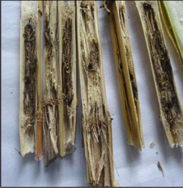
चित्र: वृद्धि मक्का के डंठल का चारकोल रोट लक्षण